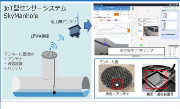
(例)LPWA を用いた下水管内水位の観測技