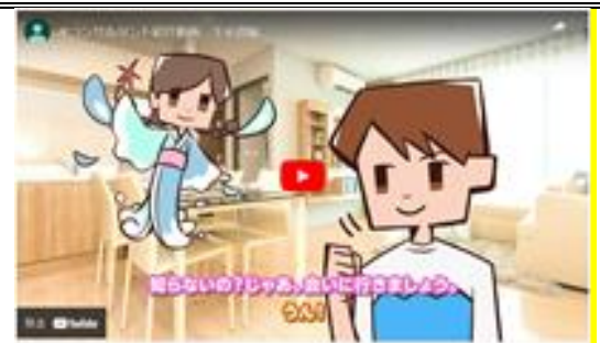
水コンサルタント紹介動画 下水道編(2021年度)