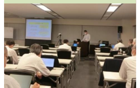
災害時支援者育成講習会